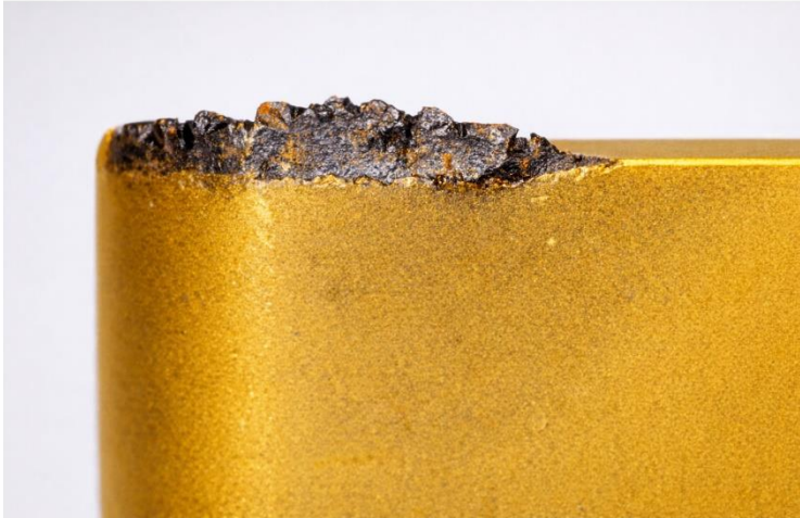
FOTO 5 Microscheggiature del tagliente con riporto

Micro scheggiature del filo dovute a vibrazioni o instabilità del sistema con incollaggio di riporto.