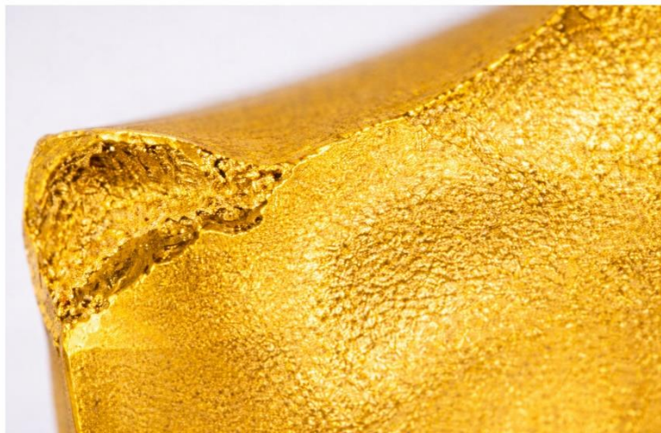
FOTO 6 Scheggiatura del tagliente

Scheggiatura del filo durante lavorazioni con taglio interrotto.