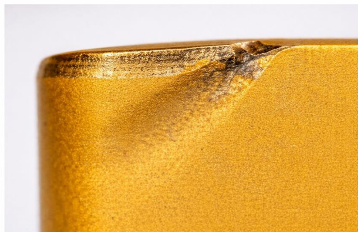
FOTO 7 Deformazione plastica del tagliente

Deformazione plastica del filo causata da sovraccarico termico.